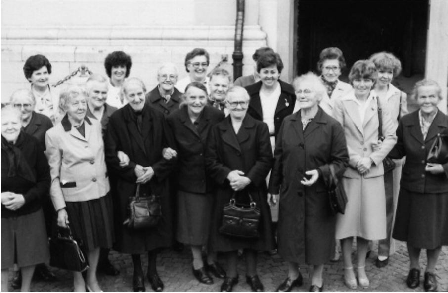
Ausflug der Ehrenmitglieder 1981 nach Abtwil