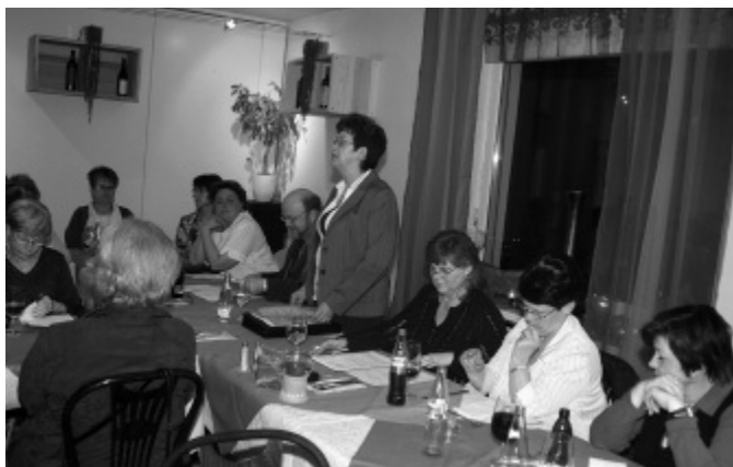
Jahresversammlung vom 22. Februar 2008

dieser Artikel wird jeweils einer wohltätigen Institution gespendet. Ein Anliegen sind uns auch Kranken- und Gratulationsbesuche – Zeit zu haben für teilnehmende Gespräche in einer ansonsten hektischen Welt.