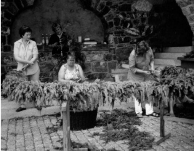
Der fertige Kranz am Eingang der Balzner Pfarrkirche